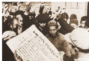
《土地改革法》受到农民的欢迎