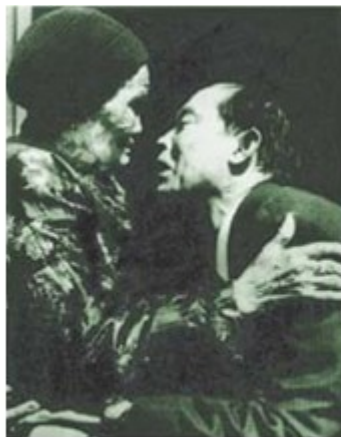
1987年11月，一台湾同胞回到大陆母亲的怀抱