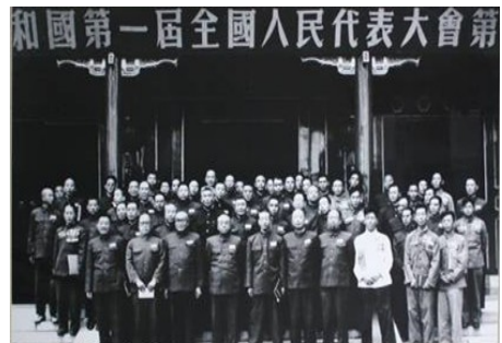
中华人民共和国第一届全国人民代表大会召开期间部分代表合影