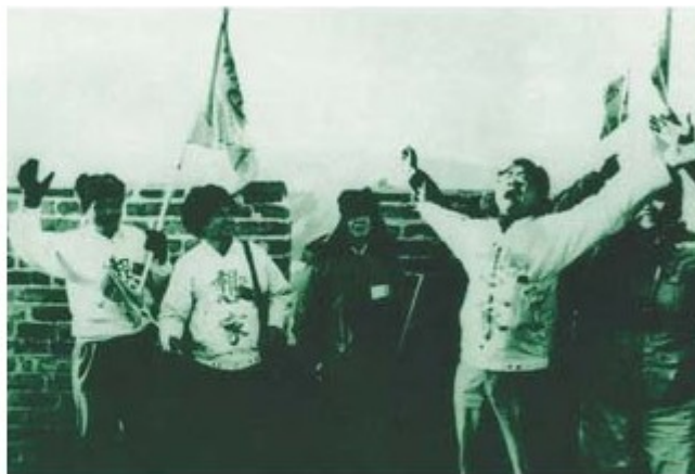
台湾同胞登上想念已久的长城的情景