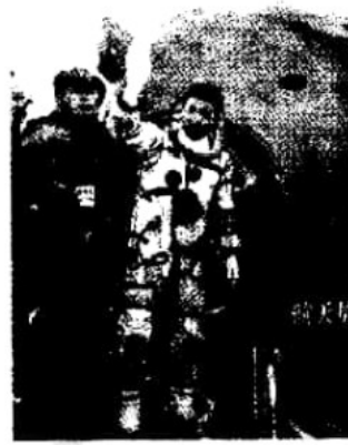
神舟五号载人飞船成功着陆， 杨利伟走出舱门