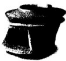
河南陕县出土的陶釜、陶灶 (约公元前5000—前3000年)