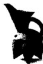
山东泰安出土的白陶鬲 (约公元前4200—前2500年)