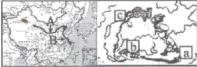
图 1 长城与大运河示意图 图 2 中央红军长征示意图

材料一 打开中国地图，有两条雄踞在中华大地上的“人工巨龙”……一撇一捺，一刚一柔，交叉在北京，形成一个大大的“人”字，成为中华民族不屈不挠和生生不息的文化象征。奇巧的是，中央红军的长征路线，也构成一个大写的“人”字。