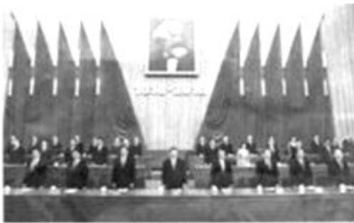
纪念马克思诞辰 200 周年大会

材料一：“让统治阶级在共产主义革命面前发抖吧，无产者在这个革命中失去的只是锁枷，他们获得的将是整个世界。”并号召“全世界无产者联合起来”