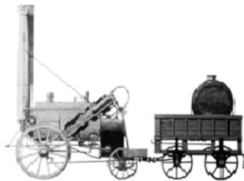
斯蒂芬森的蒸汽机车

(3). 解释板块三。根据前言和结语并结合所学知识，简要介绍现代化给英国在政治、经济等方面带来的变化。