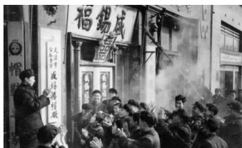
天津盛锡福帽厂挂牌仪式

(2019·广西贺州) 6. 组图3为1956年1月拍摄的照片。它反映了当时我国进行的（ ）