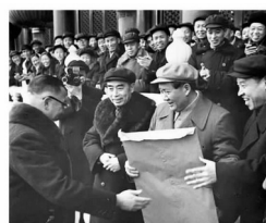
工商界代表向党中央和毛主席报喜