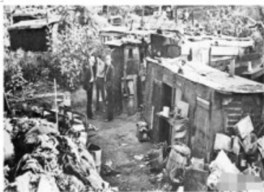
经济大危机时期美国穷人居住的棚户区——“胡佛村”