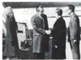
图一 中国代表团在26届联合国大会上 图二 尼克松总统与周恩来总理历史性握手

(1) 根据材料一和所学知识，自19世纪中叶起西方列强 什么要向东亚“不断扩张”？