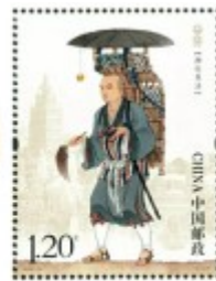
玄奘西行求法（邮票）