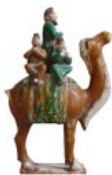
唐三彩骑驼乐俑图