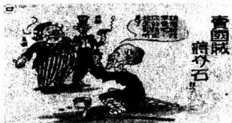
图 1：文字是“请借给我军费吧，你（英美）的请求我全都听见了”