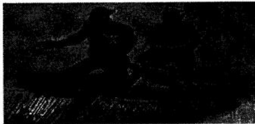
图 2：狡诈的英国兵指引着中国军人走向日军刺刀阵。文字是“难道连你的魂灵都卖给它，重新扮演聊斋中人吗？”