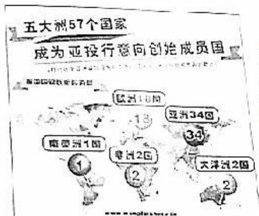
图7 截至2015年4月15日，中国倡议的亚洲基础设施投资银行（亚投行）意向创始成员国增至57个。涵盖了除美国之外的主要西方国家以及除日本之外的主要东方国家。