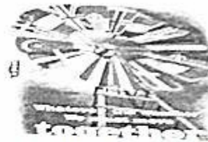
图6 二十世纪五十年代法国的宣传画。画中的英法德等国国旗排成一个风车状，美国国旗位于风车负责控制方向处，英文意思为：“无论在任何恶劣天气下，我们会共同向前走”。