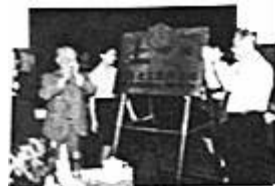
中国石油化工集团公司的挂牌仪