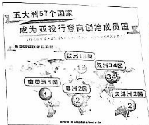
图7 截至2015年4月15日，中国倡议的亚洲基础设施投资银行（亚投行）意向创始成员国增至57个。涵盖了除美国之外的主要西方国家以及除日本之外的主要东方国家。