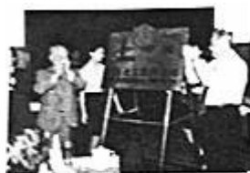
中国石油化工集团公司的挂牌仪