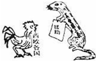
图5 漫画家华君武1947年的作品《黄鼠狼给鸡拜年》。黄鼠狼身上的文字为“美帝国主义”。