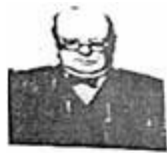
图1 丘吉尔“铁幕”演说