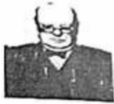
图1丘吉尔“铁幕”演说