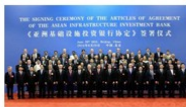
亚投行协定签署仪式