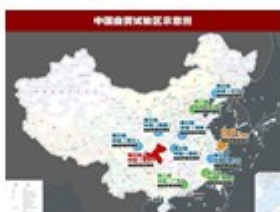
自由贸易试验区示意图