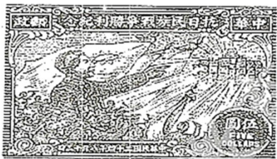
图1 抗日民族战争胜利 (中华民国三十四年)