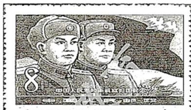
图2 中国人民志愿军凯旋归国

材料二 在改革开放的历史条件和时代背景下，邓小平先生提出了“一国两制”伟大构想，并以此为指引，通过同英国的外交谈判，顺利解决了历史遗留的香港问题。20年前的今天，香港回到祖国的怀抱，洗刷了民族百年耻辱，完成了实现祖国完全统一的重要一步。香港回归祖国是彪炳中华民族史册的千秋功业，香港从此走上同祖国共同发展、永不分离的宽广道路。