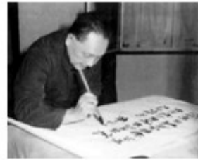
邓小平为深圳特区题词