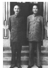
图二 毛泽东与蒋介石在重庆

材料三：湖南农民彭立成于1974、1980、1984年春节时贴的对联分别为：“过年只有两升米，压岁并无一分钱，横批：“我也过年”；“过年储米十余担，压岁存款上千元”，横批：“欢度春节”；“人有勤劳致富两只手，家有吃穿住用四不愁”横批：“永远跟党走”。彭立成家是中国现代农村千万农民家庭的一个缩影，“永远跟党走”已成为广大农民的共同心声。