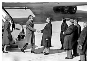
图二 跨过大洋的握手

材料四： 2018年3月以来，美国政府采取加征关税等措施，单方面挑起中美经贸摩擦。