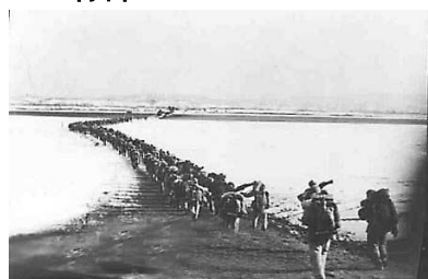
图一 中国人民志愿军跨过鸭绿江