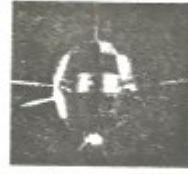
C. “东方红一号”发射成功