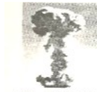
A. 第一颗原子弹爆炸成功