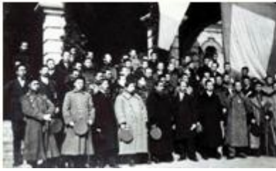
1912 年南京临时政府成立