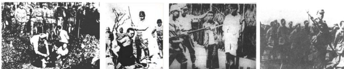
集体活埋南京市民 以砍杀中国人为游戏 把平民当刀靶练习刺杀 将中国人押往郊外集体屠杀