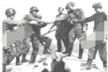
1945年4月，美苏军队在易北河会师