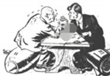
美苏领导人在古巴导弹危机中“较量”