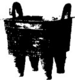
图 2 商代早期青铜方鼎