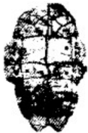
图 1 刻有文字的甲骨