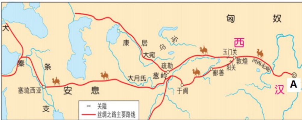
丝绸之路主要路线 (图 1)

材料二 1487 年，迪亚士在航行中因遭遇大风而意外绕过非洲西南端的好望角，到达非洲东海岸。