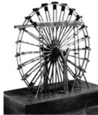
图 农业工具模型图