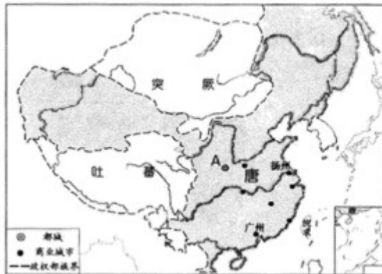
图 唐开元年间形势图