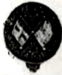
图3 武昌起义纪念章