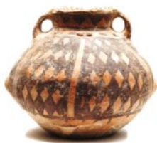
新疆哈密出土的彩陶罐

16. 过不同类别的材料，我们可以感受到历史演进的脉搏。阅读下列材料，回答问题。