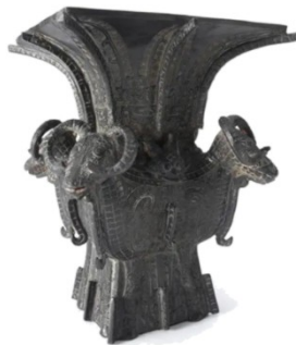
四 羊 方 尊