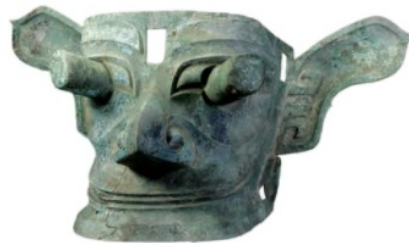
青 铜 面 具