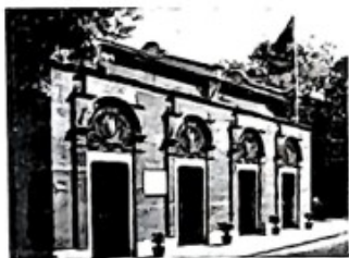
中国共产党第一次全国代表大会上海会址

中国共产党的历史是一部中国共产党带领中国人民通过不断斗争、探索中国革命新道路、最终取得新民主主义革命伟大胜利的历史；也是一部中国共产党领导全国各族人民进行社会主义革命和建设、为国家富强和人民幸福而不懈努力的历史。