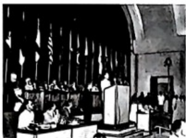
图一 周恩来在万隆会议上发言