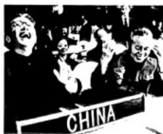
图二 乔冠华在第26届联合国大会上开怀大笑