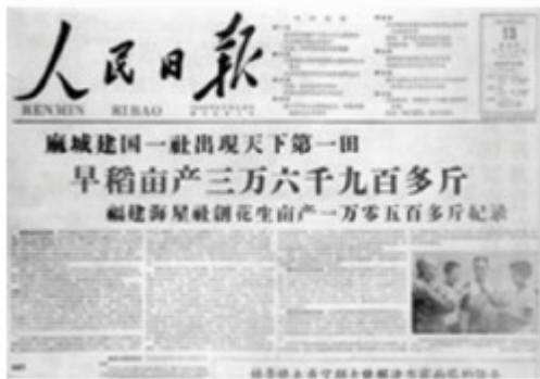
图 5 1958 年 8 月 15 日《人民日报》