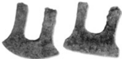
图 1 春秋战国时期的铁犁