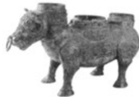
图 2 春秋末期穿有鼻环的牛尊

材料二：根据《汉书》记载：周朝分封的诸侯国大约有“千八百国”。到春秋时期，还剩 140 多个诸侯国；到战国初期，只剩下十几个诸侯国。