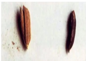
图1 玉蟾岩遗址出土的稻谷 (距今约12000年至10000年)