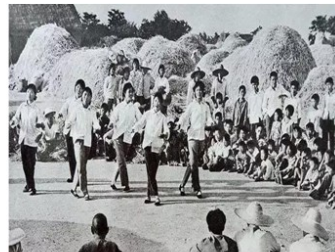
图6 凤阳农民打花鼓庆丰收