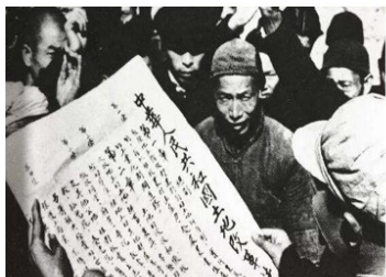
图4 《中华人民共和国土地改革法》 受到广大农民的热烈拥护