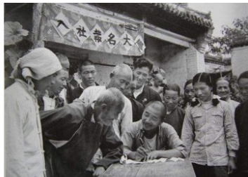
图5 农民中请加入农业生产合作社