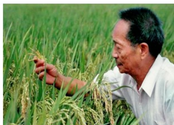
图3 袁隆平在田间观察水稻

(1) 图1反映了我国水稻栽培在世界历史上怎样的地位？图2的秧马大大提高了水稻种植效率。请另举一例宋朝水稻种植的成就。图3袁隆平在杂交水稻方面获得了什么称号？