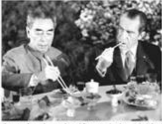
周恩来总理招待尼克松总统的宴会