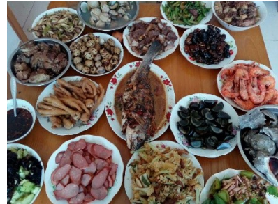
二十世纪五六十年代食物匮乏的农村生活 1978年后丰盛的农村餐桌

材料二 正如学者们所说，中国农民远非如许多人想象的那样是一个制度的被动接受者，他们有着自己的期望、思想和要求。……(农民)以不易察觉的方式改变、修正，或是消解着上级的政策与制度，1978年开始，农业发展实现了“变”与“不变”……中国农业水平的不断发展，农业农村形势持续稳中向好，美丽乡村建设深入推进……农业机械化水平超过66%，农业科技进步贡献率达57.5%，灌溉面积达10.08亿亩，一半以上的农田旱涝保收，新型职业农民超过1400万人，各类新型主体达330万家，农药使用量连续负增长，从传统到现代，农业生产面临千年未有之变局。