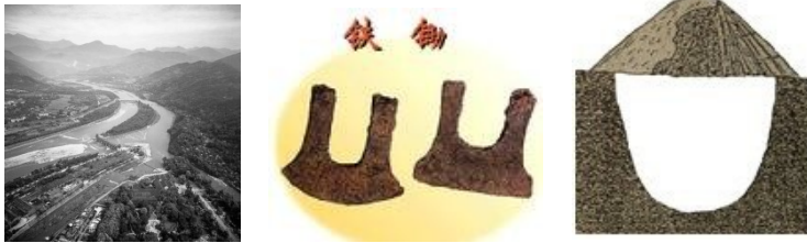
都江堰铁制农具的出现含嘉仓示意图