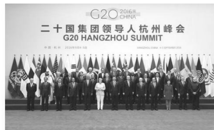
2016年二十国集团领导人杭州峰会举行