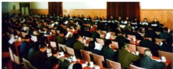
中共十一届三中全会会场

材料三 2013年习近平在十二届全国人大一次会议上深刻阐述了中国梦的宏伟蓝图，强调中国梦就是要实现国家富强、民族振兴、人民幸福；实现中国梦，必须走中国道路，弘扬中国精神，凝聚中国力量；