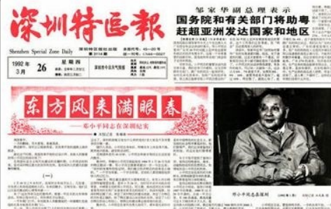
图一 邓小平题词 图二 1992年，邓小平南方讲话

邓小平为深圳特区题词： “深圳的发展和经验证明， 我们建立 A 的政策是正确的。 ——1984年1月26 日