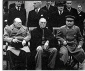
图一 1919年参加会议的“三巨头” 图二 1945年参加会议的“三巨头”

材料二：杜鲁门国会演讲中指出：“世界已分为‘极权政体’和‘自由国家’两个敌对堡垒。美国对外政策的总原则是：帮助自由民族保持他们的自由制度和国家完整，对抗想把共产主义强加给他们的侵略活动。”