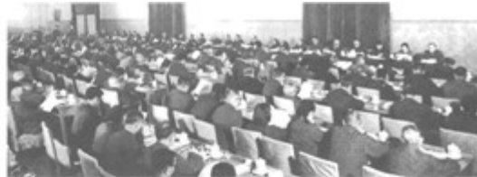
图片二：中共十一届三中全会会场