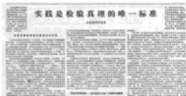
图片一：关于真理标准问题的大讨论