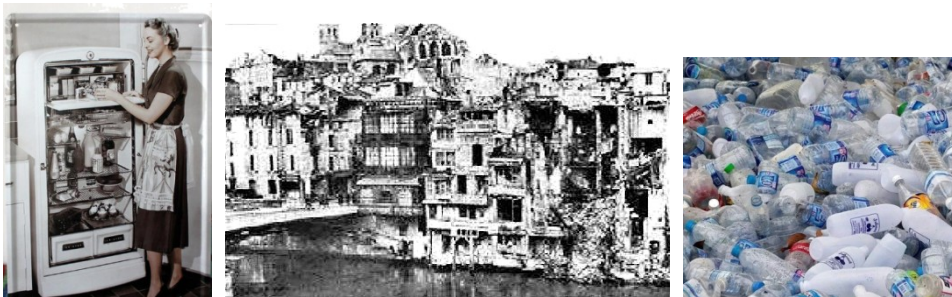
冰箱入厨房 遭到炮轰后的凡尔登 废弃的塑料瓶

(2) 材料二是小组同学找到的 20 世纪以来的一些图片。请你具体说明材料一与材料二之间的内在联系。