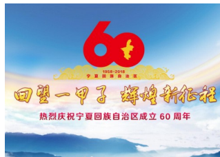
图 2 香港特别行政区区旗 图 3 澳门特别行政区区旗 图 4 宁夏回族自治区成立 60 周年海报