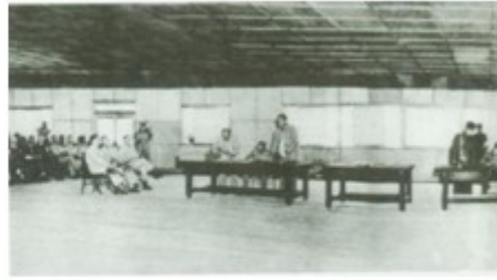
图三 《朝鲜停战协定》签字仪式