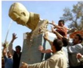
美军占领巴格达后， 萨达姆像被推翻

材料三：1999年，以美国为首的……打着“人权高于主权”的幌子，越过联合国安理会，对南斯拉夫联盟进行了持续78天的轰炸……2003年，美国又以伊拉克拥有大规模杀伤性武器为借口，未经联合国授权，拉拢部分国家，发动战争，占领伊拉克。