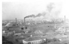
汉阳铁厂是中国第一个近代化的钢铁厂

材料一：洋务运动前期，洋务派以“自强”为口号，采用西方先进生产技术，创办了一批近代军事工业……江南制造总局是洋务派开办的最大的近代军事工业，它用自炼钢材仿制的毛瑟枪，能赶上德国新毛瑟枪的水平；它研制的无烟火药达到世界先进水平……洋务运动后期，洋务派又以“求富”为口号，开办了一些民用工业。