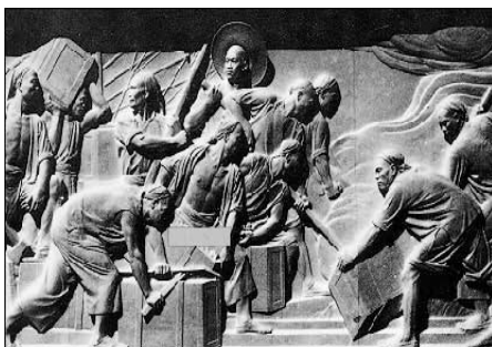
虎门销烟 印度圣雄甘地 弹元勋邓稼先