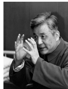
两 个 写 正 字

(2)、根据材料三，选取具中一史实，以爱国为主题，自拟题目，一篇历史小论文(6分，要求观点明确，史论结合，文字通畅，200