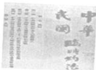
1912年资产阶级颁布的宪法

【考点】32：秦朝巩固统一的措施；96：辛亥革命；DD：社会主义民主与法制建设的加强；PD：历史开放性问题。