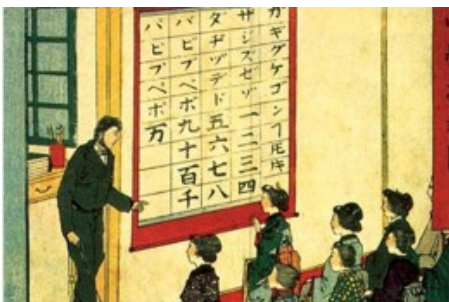
明治维新时期的课堂