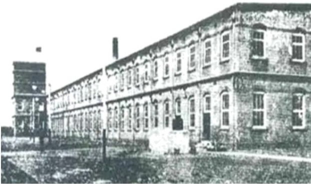
张謇在江苏南通创办的大生纱厂

12. 下图所示的工厂是创办于清末的一所私营棉纺织企业。2018 年 1 月 27 日，入选“中国工业遗产保护名录”。2018 年 11 月 15 日，列入“第二批国家工业遗产名单”。该企业（ ）