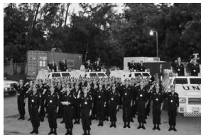
中国赴海地维护部队