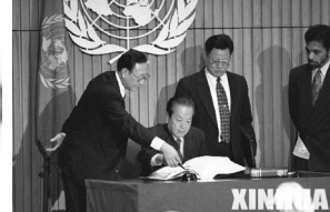
签署《全面禁止核实验》