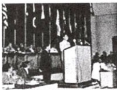
周恩来在万隆会议演讲