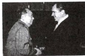
毛泽东会见尼克松