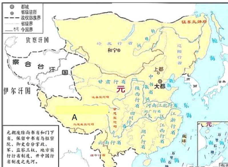
图一 元朝形势图1330年