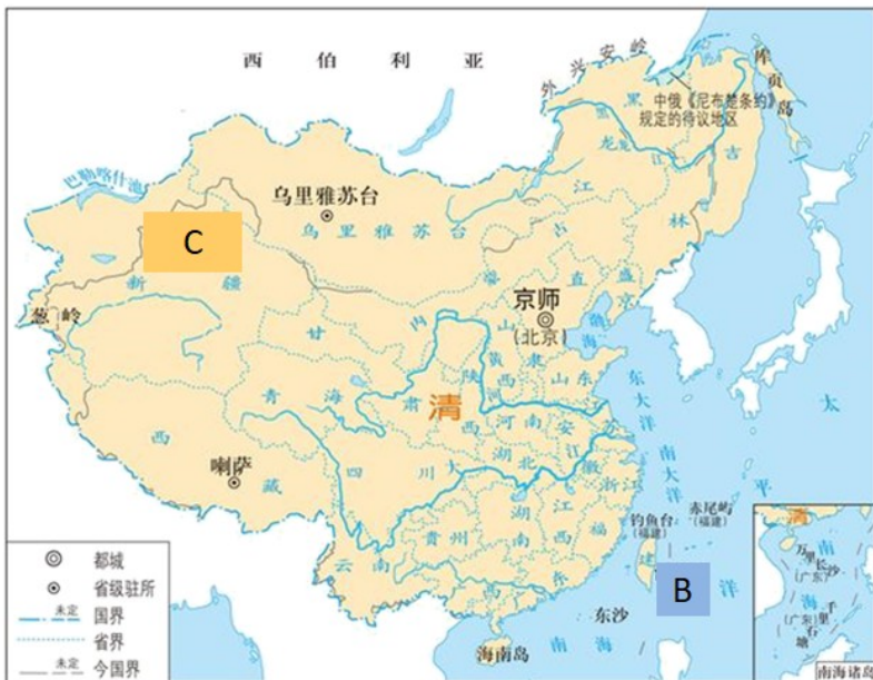
图二 清朝疆域图1820年

材料二：我们提出的大陆与台湾统一的方式是合情合理的。统一后，台湾仍搞它的资本主义，大陆搞社会主义，但是是一个统一的中国。