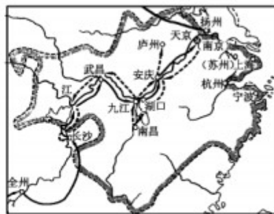
图2 太平天国主要活动区域

A. 划分“势力范围” B. 扶植清政府作为统治中国的工具 C. 进行资本输出 D. 使战争中获得的权益能得以落实