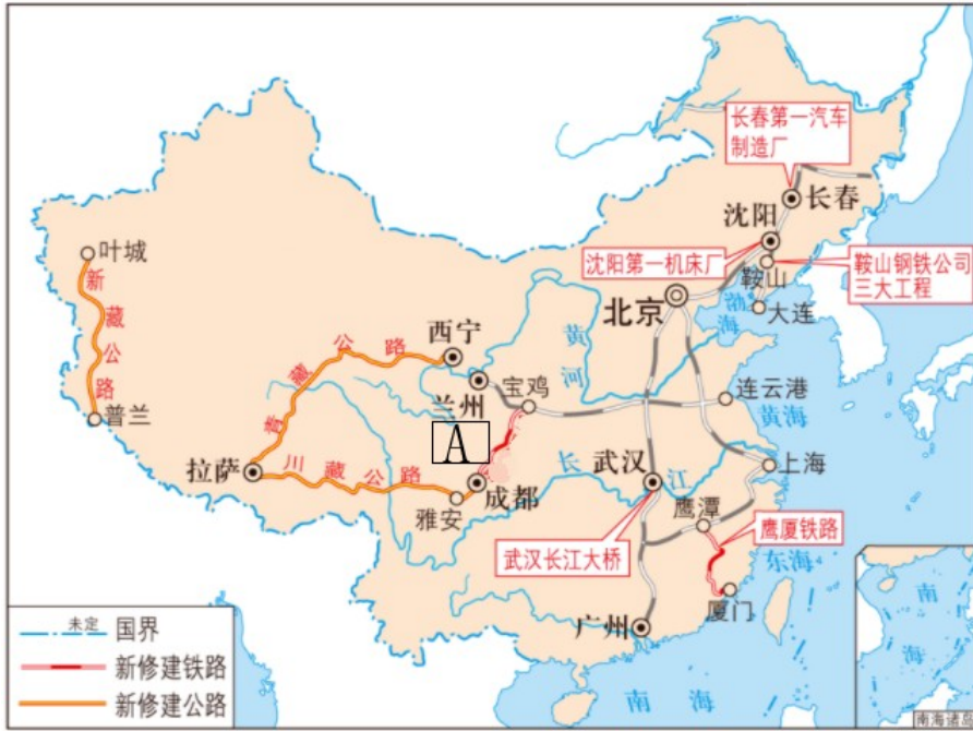
图一 据部编版《中国历史（八年级下册）》