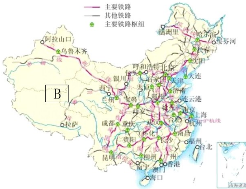
图二 据人教社《初中地理（八年级上册）》

(4) 依据材料四结合所学，写出图中 A、B 两处所示的铁路线名称及与之出现相关的计划和政策。观察图一、图二，概括我国铁路发展的变化。