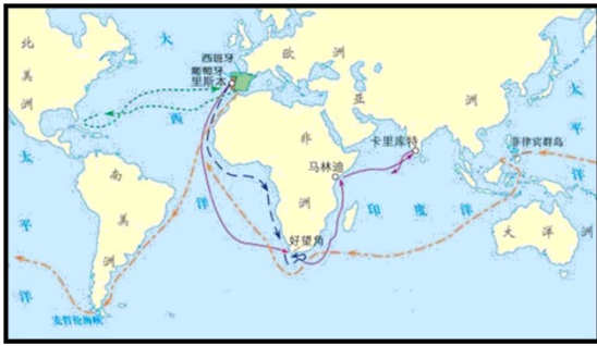
新航路的开辟示意图