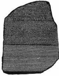
古埃及罗塞塔石碑