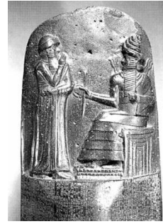
《汉谟拉比法典》石柱