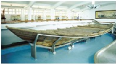
图1 出土泉州的南宋海船