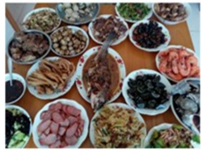
1978 年后丰盛的农村餐桌

材料二：正如学者们所说，中国农民远非如许多人想象的那样是一个制度的被动接受者，他们有着自己的期望、思想和要求。……（农民）以不易察觉的方式改变、修正，或是消解着上级的政策与制度，1978 年开始，农业发展实现了“变”与“不变”……中国农业水平的不断发展，农业农村形势持续稳中向好，美丽乡村建设深入推进……农业机械化水平超过 66%，农业科技进步贡献率达 57.5%，灌溉