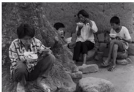
二十世纪五六十年代食物匮乏的农村生活