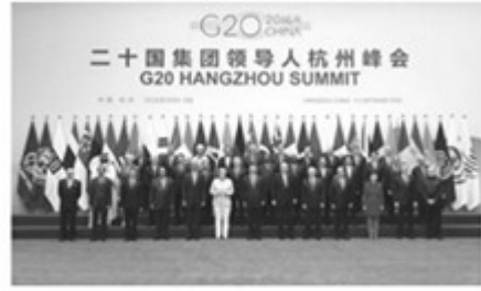
2016年二十国集团领导人杭州峰会举行