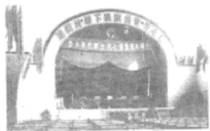
中国共产党第七次全国代表大会会场

材料 1944年5月21日至1945年4月20日举行的中共六届七中全会和会上通过的《关于若干历史问题的决议》。增强了全党在毛泽东思想基础上的团结……在抗日战争接近最后胜利的前夜，为总结中国革命的基本经验，为彻底打败日本侵略者、建设新中国做准备，1945年4月23日至6月11日，中国共产党第七次全国代表大会在延安举行。出席大会的代表共计755人，代表着全党121万名党员。大会提出党的政治路线是：“放手发动群众，壮大人民力量、在我党的领导下。打败日本侵略者，解放全国人民， 建立一个 的中国。”