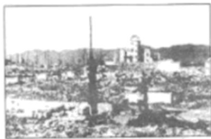
原子弹轰炸后的广岛一片瓦砾

材料一 1945年8月6日，美国B-29型轰炸机在日本广岛上空1万米处投下了一枚原子弹，使爆炸中心区域及附近区域立即被摄氏7000度的高温吞没，造成约14万人死亡。翌日，日本当局敦促科学家去广岛实地调查，及至获知真相，深深为之战栗。8月9日，美国又向日本长崎投下了一枚原子弹，造成约7万人死亡。