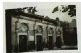
中国共产党第一次全国代表大会上海会址